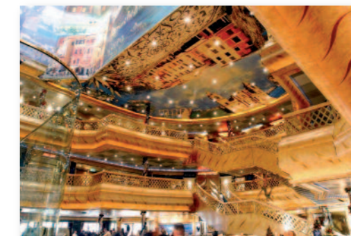
Le bar principal