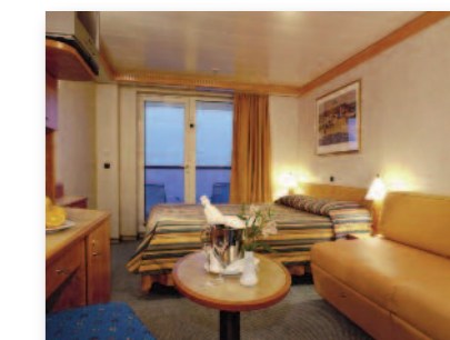
Cabine avec balcon

Les cabines sont toutes de même taille et très confortables. Comme l'indique leur intitulé, certaines sont « aveugles » (intérieures), d'autres avec fenêtre, d'autres enfin avec fenêtre et balcon. Toutes ces cabines sont équipées d'une literie de premier plan, d'un minibar, d'une télévision avec programme vidéo intégré, d'une commode, de placards de rangement, d'un petit coffre fort, d'une salle de bains avec douche, des serviettes de bains et d'un sèche-cheveux pour les dames. Toutes les cabines peuvent être équipées de 2 lits bas ou d'un grand lit.