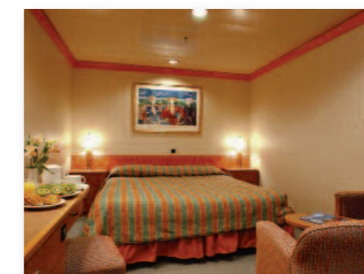
Cabine intérieure A ou B