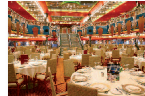
L'un des restaurants