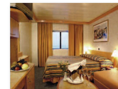
Cabine avec fenêtre