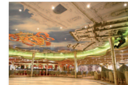
Le salon dansant